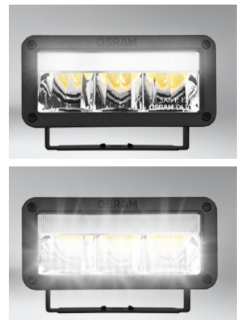
LEDriving Lightbar M140-SP

0,25lx: 390m 0,5lx: 275m 1lx: 200m 3lx: 110m